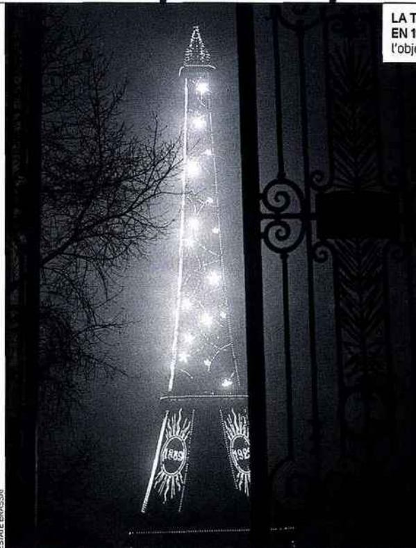
LA TOUR EIFFEL EN 1932